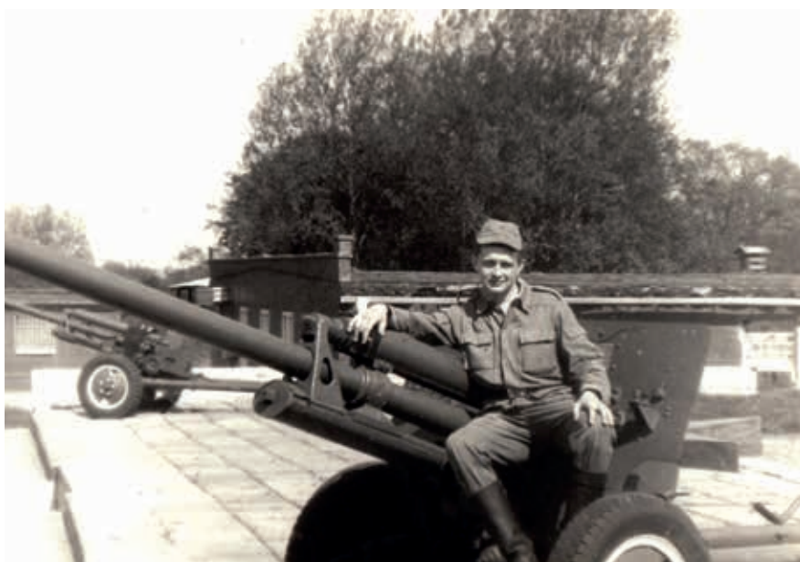
Служба в Германии