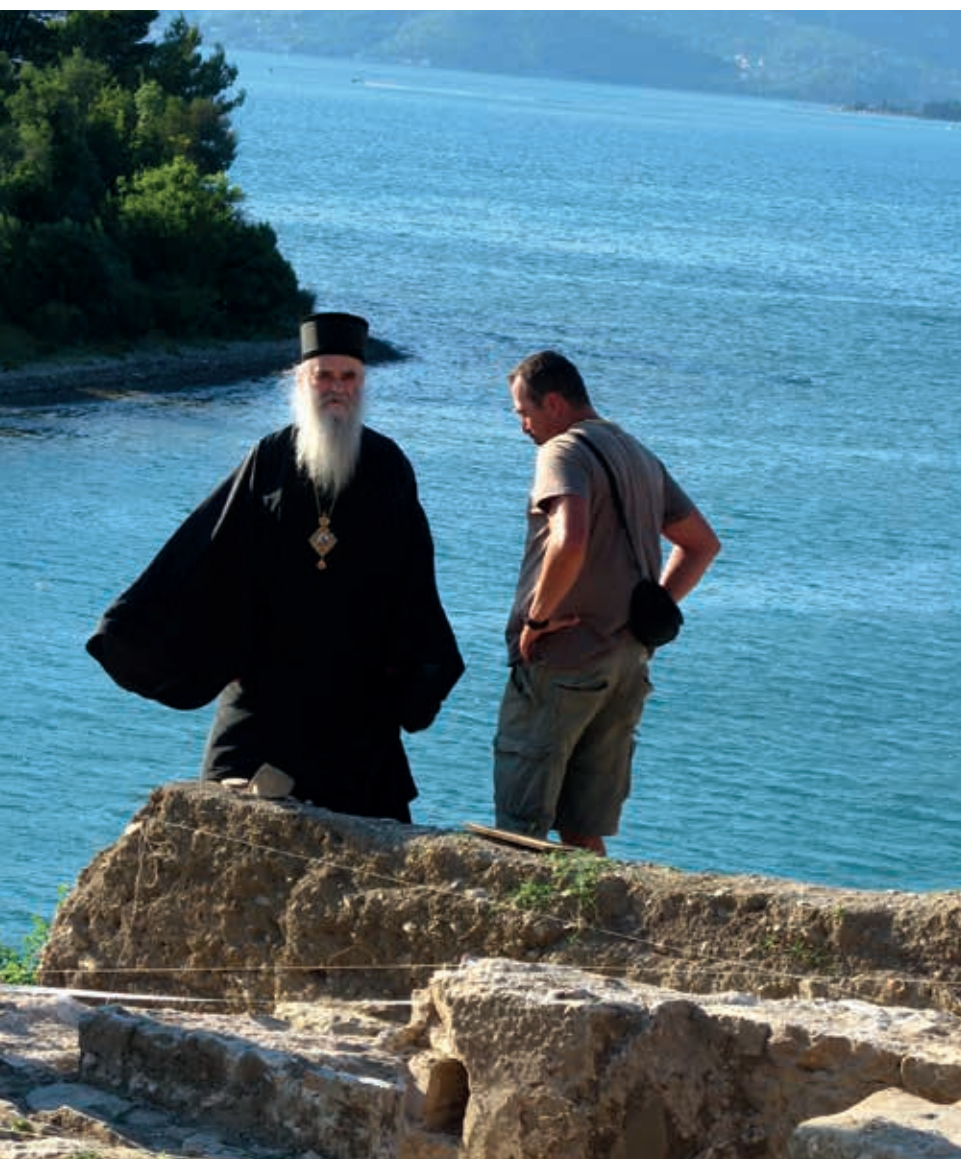
Доверительный разговор на острове Цвечи

святой блаженной Матроны Московской построили! Это очень важно, поскольку укрепляет духовные связи между нашими народами, считал владыка.