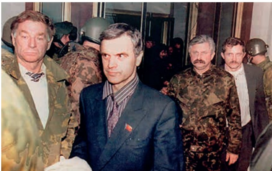
Арест в осаждённом здании Верховного Совета, 1993 г.