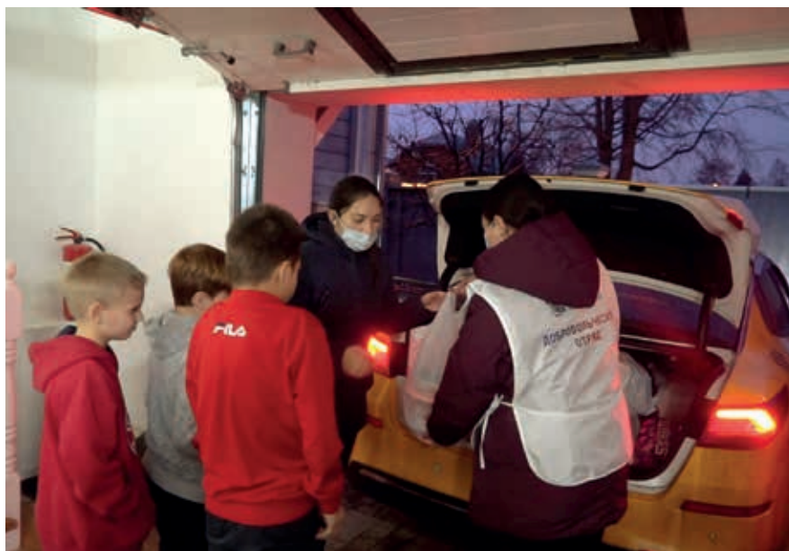
Добровольцы привезли вещи в приют, г. Коломна

посвященный памяти павших в боях подо Ржевом в 1942-1943 годах в Великую Отечественную войну. В этот день волонтеры посетили также Псково-Печерский монастырь – одно из уникальных мест России. Всем добровольцам были розданы послушания в разных местах монастыря: Святая гора, Успенская площадь, пещеры. Кто-то убирал листву, кто-то работал в палисаднике – приводил в порядок цветы и кусты голубики. Проведена была также уборка в пещерах и храмах.