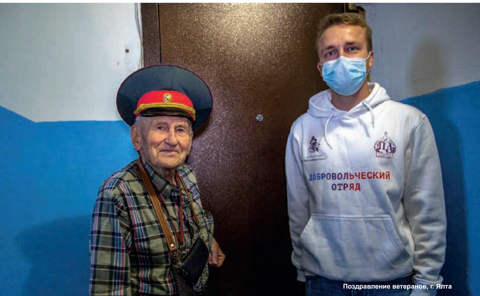
Поздравление ветеранов, г. Ялта