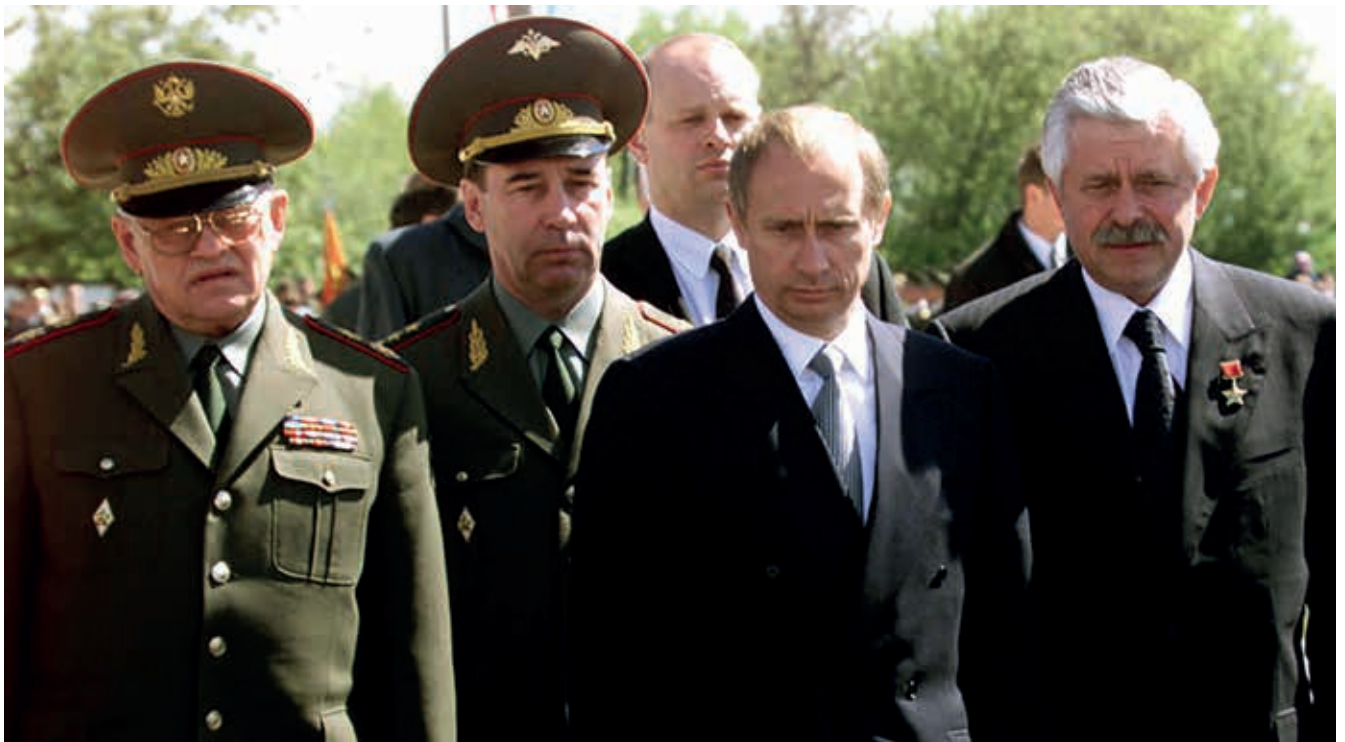
Президент РФ В.В. Путин, губернатор Курской области А.В. Руцкой на открытии мемориального комплекса «Курская дуга», 8 мая 2000 г.

в посольство США. Я неоднократно останавливал его, уберегая от позора. В крайний раз при такой попытке я спросил разрешения лететь в Фарос за арестованным Горбачевым. Он сказал, что мне не удастся это сделать, и нет смысла рисковать. Одним словом, ни да, ни нет. Но я понимал, что нельзя допустить кровопролития в Москве, поэтому было принято решение вместе с генерал-лейтенантом МВД А. Ф. Дунаевым лететь. Я попросил его взять с собой двадцать офицеров спецназа внутренних войск, и мы выдвинулись в аэропорт Внуково. Вся дорога к аэропорту была заставлена танками и БТР. Нам удалось добраться до аэропорта, захватили самолет вице-президента СССР Янаева и улетели в Фарос. Как летели и приземлялись, это долгий рассказ. Прилетели на место. Оказалось, что Горбачева никто не арестовывал. Перед дачей Горбачева стояли Язов, Крючков и Лукьянов. Я спросил у них, почему они стоят перед входом на территорию дачи и не заходят, ведь Горбачев арестован. На что мне ответили, что его никто не арестовывал, и их туда просто не пускают. Дмитрий Тимофеевич Язов сказал мне: «Сходите вы, может, вас пропустят». Меня пропустил начальник службы охраны Горбачева Медведев. При встрече с Горбачевым все стало ясно. Никто