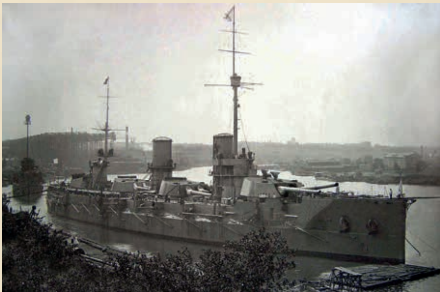
Флагман эскадры – линкор «Генерал Алексеев»

Старшие инженер-механики и специалисты прилагали все возможные силы для улучшения воистину трагического положения кораблей, сами выполняли слесарные и кузнечные работы, обучая этому команду. Мастерские Севастопольского порта и транспорта «Кронштадт» не в силах были прийти на помощь флоту из-за отсутствия в порту и на русском рынке на территории Крыма нужных материалов. Предметы снабжения судов отсутствовали. Флот держался только силой духа, русской смекалкой и неутомимостью энергии лучших специалистов из числа офицеров и команды.