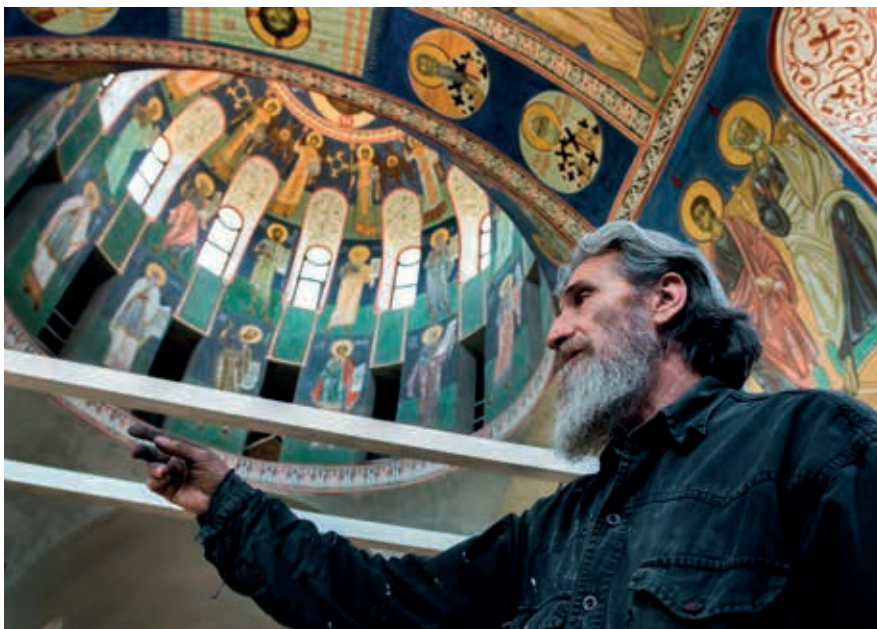
Бато расписывает храм

«Я хочу, чтоб у нас одна страна была – от Цетинье до Владивостока. Чтобы не существовало границ, и мы жили все вместе!» Очень любил владыка Амфилохий Россию, Русскую Церковь. На Афоне у преподобного Паисия