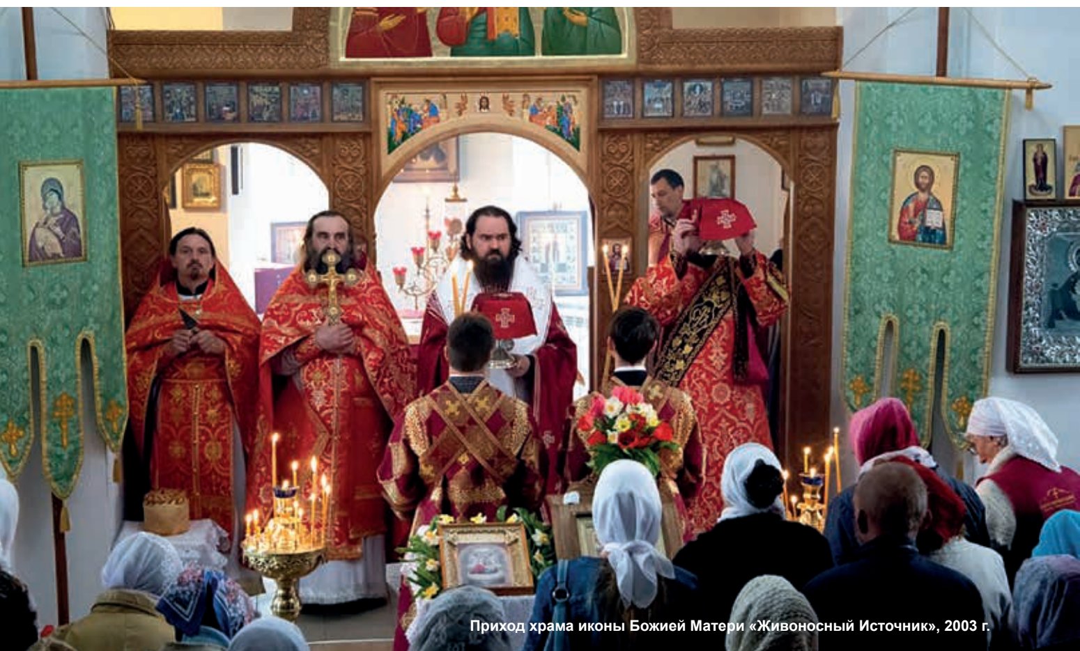
Приход храма иконы Божией Матери «Животворящий Источник», 2003 г.