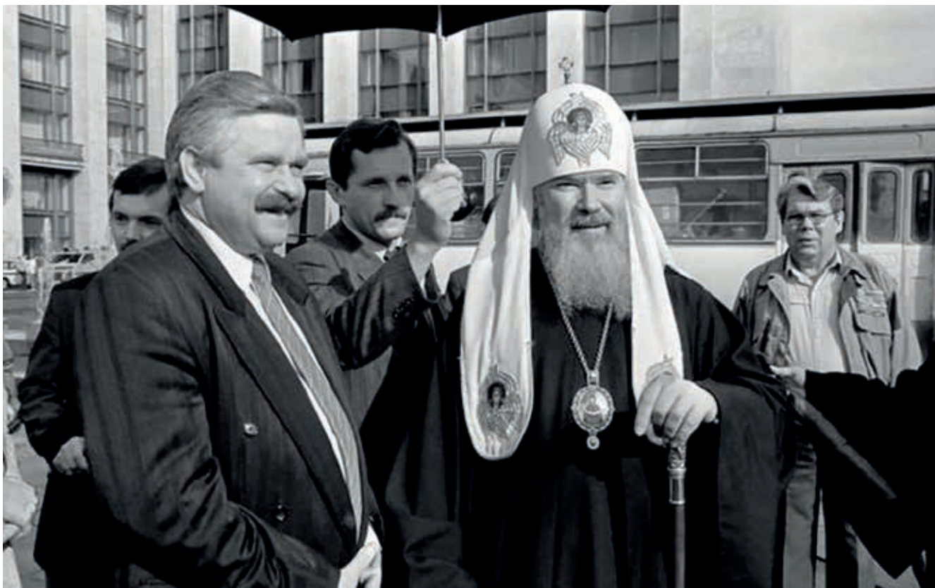
С Патриархом Московским и Всея Руси Алексием

его не арестовывал, он просто сбежал, чтобы не подписывать новый союзный договор, тем самым подставив своих товарищей. Как выяснилось позже, ГКЧП был создан Горбачевым еще в марте 1991 года. Я убедил Горбачева лететь с семьей на моем самолете. Ночью мы вернулись в Москву, и на этом все закончилось.