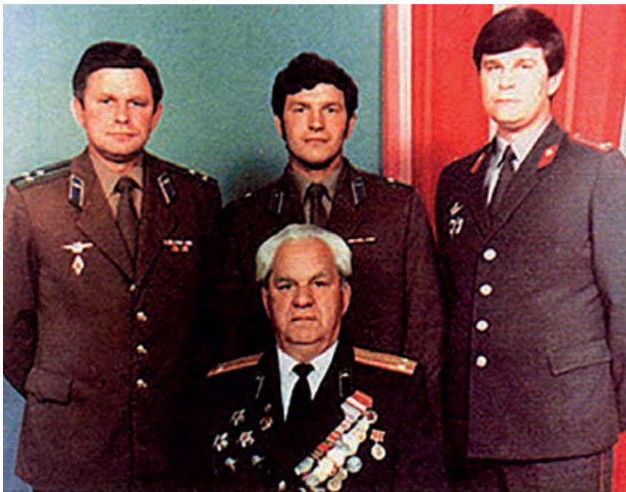
Династия Руцких (с отцом и братьями)