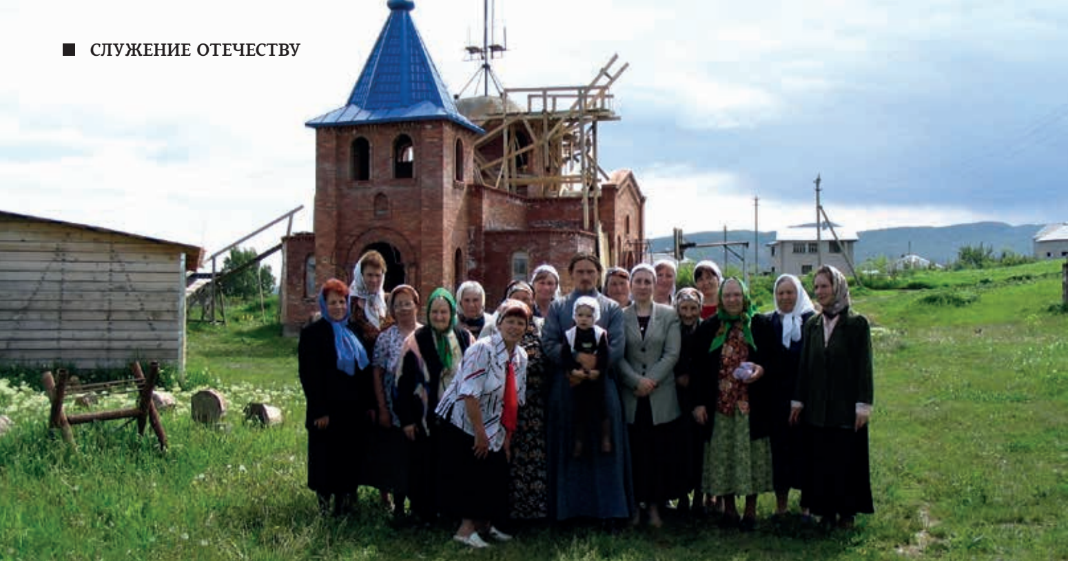
Первая Пасхальная служба в строящемся храме, 2004 г.

дьяконом. А потом, когда рукоположили в священники, меня отправили в Железноводск, где прослужил около пяти лет в храме Покрова Божьей Матери.