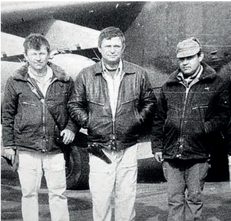
Афганистан, командир полка. После боевого вылета

удара по ПВО. В первый вылет я привез 27 пробоин на самолете. Засекли не все координаты ПВО, пришлось делать еще один вылет. Отличился американский инструктор, применив ПЗРК «Стингер», практически на неуправляемом самолете я дотянул до нейтральной полосы, катапультировался, но поздно, весь переломался, вытаскивали меня афганцы на БТР, отстреливались, чтобы меня не захватили «духи», и дали возможность сесть нашему вертолету и забрать меня. Прямым ходом вертолет отправился в госпиталь 40-й армии, дальше операции на позвоночнике