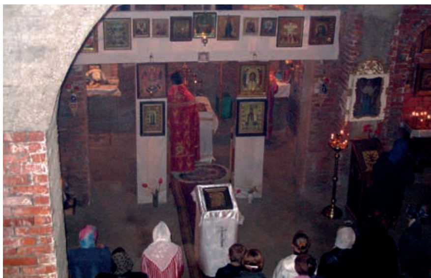
Приход храма иконы Божией Матери «Живоносный Источник», 2003 г.

– С одной стороны, считаю, что мне повезло. Были какие-то деньги, и мы