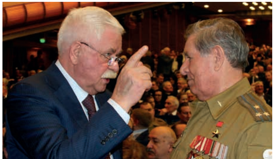
30 лет вывода войск из Афганистана